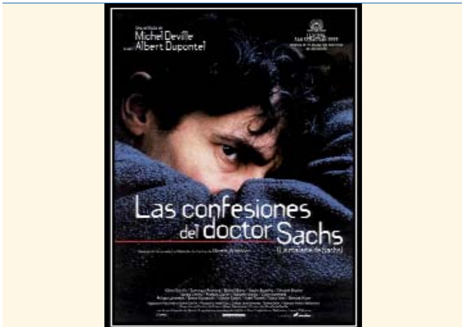
Figura 2. Las confesiones del Dr. Sachs (Michel Deville, 1999).