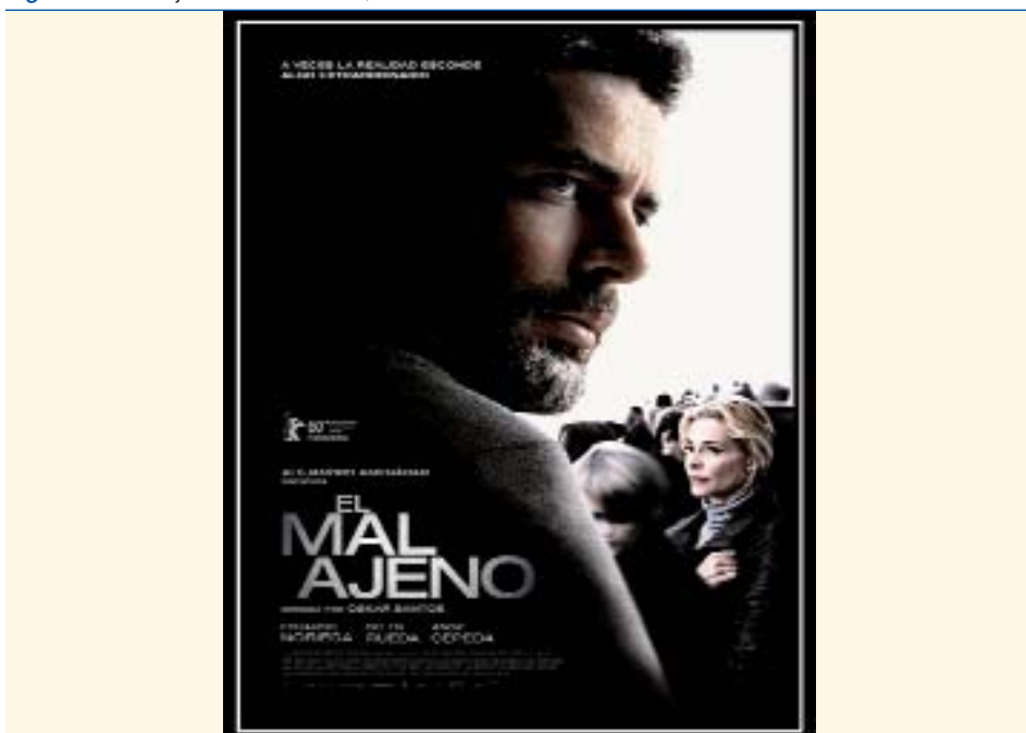
Figura 5. El mal ajeno (Oskar Santos, 2009).

No sólo el cine panorámico es una oportunidad para mejorar la enseñanza y la humanización en medicina, también las series de televisión sobre temas médicos: Anatomía de Grey , Urgencias , Hospital Central , Scrubs ... hasta House (porque también de los errores se aprende...). Cualquier iniciativa artística aplicada a la humanización de la medicina debe ser bienvenida.