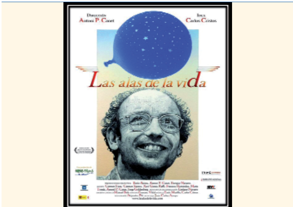
Figura 4. Las alas de la vida (Antoni P. Canet, 2006).